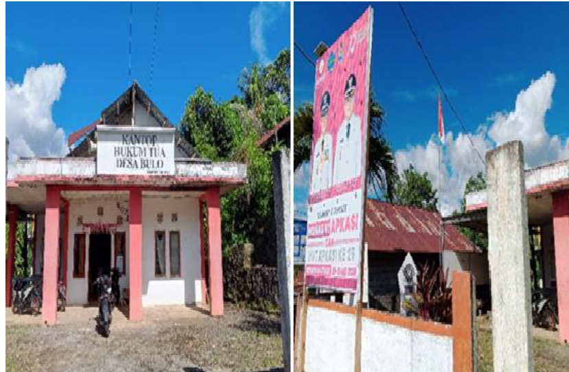
Gambar 2: Kantor Hukum Tua Desa Bulu

langsung berinteraksi dengan masyarakat. Istilah “ Hukum Tua ” merupakan nomenklatur lokal khas Minahasa yang merujuk pada kepala desa, yang tidak hanya memiliki peran administratif tetapi juga sosial-kultural dalam menjaga tatanan kehidupan masyarakat desa. Kantor ini dirancang untuk mendukung penyelenggaraan fungsi pemerintahan desa, mulai dari pelayanan administratif (penerbitan surat-surat, pengarsipan, hingga verifikasi data kependudukan), penyelenggaraan musyawarah desa, hingga pelaksanaan program pemberdayaan masyarakat dan pembangunan berbasis partisipasi warga. Dalam perspektif tata kelola pemerintahan lokal ( local governance ), keberadaan dan fungsi Kantor Hukum Tua mencerminkan penerapan prinsip-prinsip transparansi, partisipasi, dan akuntabilitas dalam pelayanan publik.