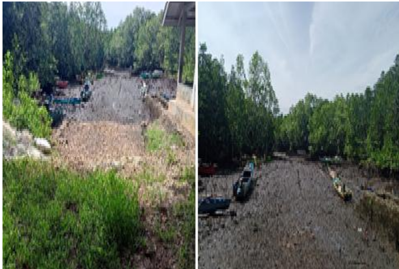
Gambar 3: Mangrove Park Desa Wisata Bulu (Tim Peneliti, 2025)

penciptaan peluang kerja dan sumber pendapatan alternatif bagi masyarakat setempat, misalnya sebagai pemandu wisata, pengelola tiket, penjaja makanan lokal, atau produsen suvenir berbahan alami.