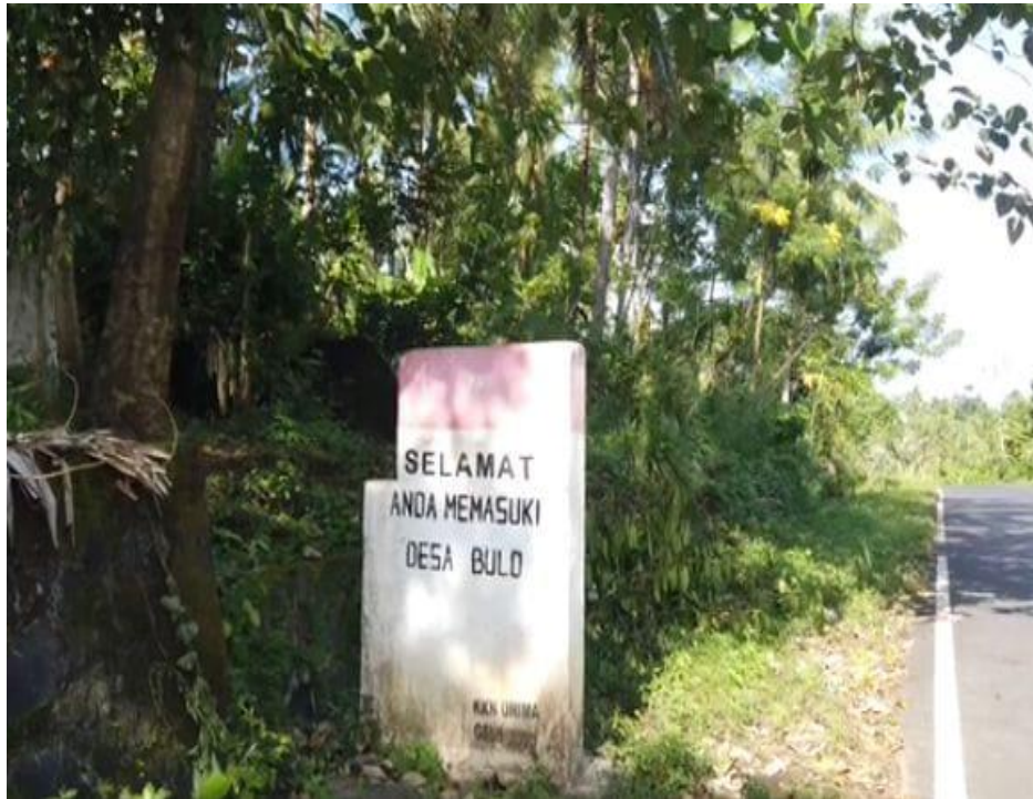
Gambar 1: Tugu Selamat Datang

Data observasi yang diperoleh secara langsung di Desa Bulu menunjukkan bahwa keberadaan tugu selamat datang memiliki makna simbolis dan strategis dalam konteks pengembangan desa wisata. Tugu ini tidak hanya berfungsi sebagai penanda batas administratif, tetapi juga memiliki nilai representatif yang mencerminkan identitas dan karakter lokal desa. Lokasinya yang berada tepat di samping jalan raya menjadikannya elemen pertama yang dilihat oleh setiap pengunjung, sehingga mampu memberikan kesan awal yang kuat tentang desa tersebut.