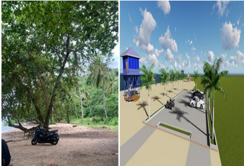
Gambar 12: Kondisi Existing dan Desain Perencanaan Area Parkir Pantai Canada

Dengan diterapkannya desain area parkir ini, diharapkan daya saing Pantai Canada sebagai destinasi wisata berbasis ekowisata akan semakin meningkat melalui penyediaan sarana pendukung yang ramah lingkungan dan berorientasi pada pelayanan publik yang optimal.