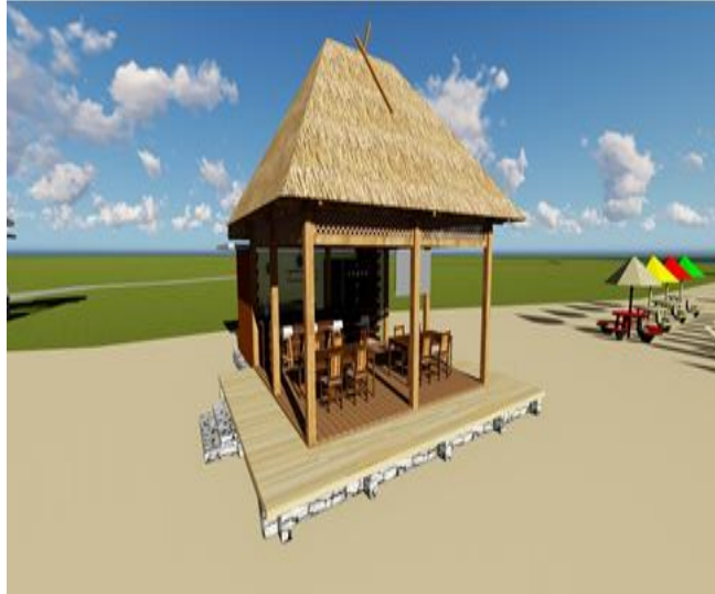
Gambar 13: Hasil Desain Resto & Bar ( Peneliti, Juni 2025)

Desain restoran dan bar ini mengadopsi konsep arsitektur tropis yang ramah lingkungan, dengan struktur atap jerami (alang-alang) dan material dominan dari kayu alami. Bentuk bangunan semi-terbuka memungkinkan sirkulasi udara alami yang baik serta memberikan pengalaman bersantap yang menyatu dengan suasana pantai. Posisi elevated (berdasarkan pondasi panggung kayu) memberi kesan eksklusif sekaligus melindungi bangunan dari kelembaban pasir dan pasang surut air laut. Desain ini diposisikan strategis di sebelah area santai (recreation lounge area), memungkinkan wisatawan untuk berpindah dari kegiatan relaksasi menuju interaksi sosial dan hiburan tanpa mengganggu alur pergerakan di kawasan pantai. Tata letak bar dan kursi diarahkan menghadap laut, menciptakan panorama visual yang memanjakan pengunjung, terlebih saat matahari terbenam. Secara fungsional, restoran dan bar ini dirancang tidak hanya sebagai tempat konsumsi makanan dan minuman, tetapi juga sebagai ruang sosial dan hiburan, di mana wisatawan dapat menikmati live music, pertunjukan kecil, atau DJ set yang bersinergi dengan suasana pantai. Dari perspektif perencanaan destinasi, desain ini mencerminkan pendekatan ekonomi kreatif berbasis lokal namun modern, yang bertujuan menambah daya tarik kawasan Pantai Canada sebagai destinasi wisata unggulan. Gaya arsitektur yang sederhana namun estetik juga mendukung prinsip pembangunan berkelanjutan, dengan memanfaatkan bahan lokal dan sistem konstruksi yang mudah direplikasi.