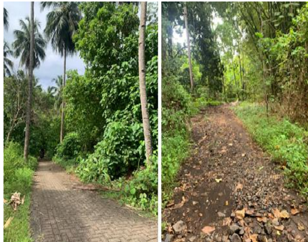
Gambar 5: Jalan masuk Pantai Canada

Oleh karena itu, diperlukan pembangunan lanjutan akses jalan secara menyeluruh dan berstandar, guna meningkatkan konektivitas serta menjamin keselamatan dan kemudahan wisatawan dalam mencapai kawasan Pantai Canada. Infrastruktur jalan yang baik merupakan komponen krusial dalam menunjang pariwisata berkelanjutan, sekaligus mendorong pertumbuhan ekonomi lokal melalui peningkatan kunjungan wisata.