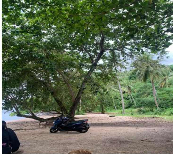
Gambar 2: Tempat parkir (Peneliti, 2025)

Selain berdampak pada kenyamanan, praktik parkir sembarangan ini memberikan tekanan fisik terhadap lingkungan pesisir, khususnya pada vegetasi alami seperti semak pantai, rumput liar, dan pohon-pohon pelindung yang tumbuh di area tersebut. Vegetasi pantai memiliki peran penting sebagai penyangga ekosistem pesisir, pengendali abrasi, dan elemen pendukung estetika lanskap. Ketika kendaraan dibiarkan melintasi atau berhenti di atas area tersebut, kerusakan ekologis dapat terjadi secara perlahan namun signifikan. Hal ini tentu bertentangan dengan prinsip pembangunan pariwisata berkelanjutan yang menekankan pada keseimbangan antara pemanfaatan dan pelestarian sumber daya alam.