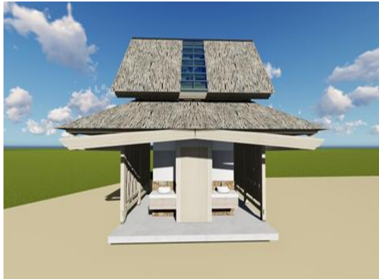
Gambar 16: Hasil Desain Ruang Bilas & Toilet (Peneliti, Juni 2025)

menyebabkan wisatawan terpaksa meminjam kamar mandi atau toilet milik rumah-rumah warga di sekitar kawasan pantai. Hal ini tidak hanya menimbulkan ketidaknyamanan bagi masyarakat lokal, tetapi juga mengindikasikan belum adanya sistem pelayanan pariwisata yang profesional dan terstandarisasi.