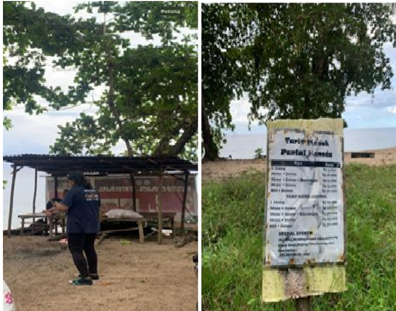
Gambar 4: Tempat pembayaran tarif masuk pantai (Peneliti, 2025)

Namun demikian, secara struktural dan sistemik, fasilitas ini masih belum ditunjang oleh infrastruktur administratif yang representatif, seperti keberadaan pos masuk permanen, sistem pencatatan pengunjung yang terstandar, serta mekanisme tiket yang mencerminkan transparansi dan akuntabilitas dalam pengelolaan retribusi. Ketiadaan elemen-elemen ini berpotensi menimbulkan ketidakteraturan dalam pencatatan jumlah pengunjung maupun penerimaan retribusi, serta melemahkan aspek profesionalisme pengelolaan destinasi wisata.