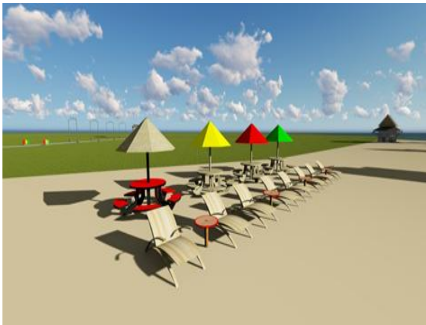
Gambar 17: Hasil Desain Area Santai

satu titik interaksi ruang yang strategis dalam keseluruhan desain destinasi. Area santai dalam konsep desain ini menyediakan payung, meja, tempat duduk untuk menambah nilai estika dari Pantai Canada selain itu para pengujung bisa berjemur dan menikmati pemandangan pantai. Secara fungsional, area santai memberikan ruang transisi antara aktivitas dinamis seperti berenang atau bermain air dengan aktivitas pasif seperti bersantai atau membaca. Hal ini penting dalam konteks perilaku wisatawan yang sangat beragam, di mana tidak semua pengunjung terlibat dalam aktivitas fisik yang intens. Dengan demikian, penyediaan ruang santai menjadi bentuk akomodasi terhadap preferensi rekreasi yang berbeda, serta berkontribusi terhadap durasi kunjungan wisata yang lebih lama. Selain itu, keberadaan fasilitas seperti payung dan meja juga memberi perlindungan dari cuaca ekstrem, terutama panas matahari tropis yang dapat mengganggu kenyamanan beraktivitas di ruang terbuka.