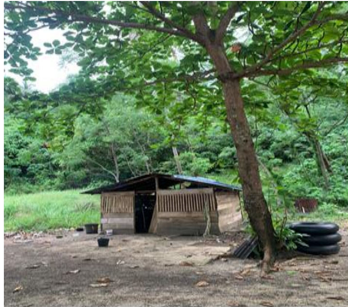
Gambar 3: Tempat Bilas

berimplikasi langsung terhadap aspek kenyamanan, kesehatan, dan keamanan pengunjung, serta secara tidak langsung memengaruhi durasi kunjungan dan kepuasan wisatawan. Dalam jangka panjang, kondisi ini dapat berdampak pada menurunnya loyalitas pengunjung dan melemahkan daya saing Pantai Canada dibandingkan destinasi lain yang telah menyediakan fasilitas sanitasi secara memadai.