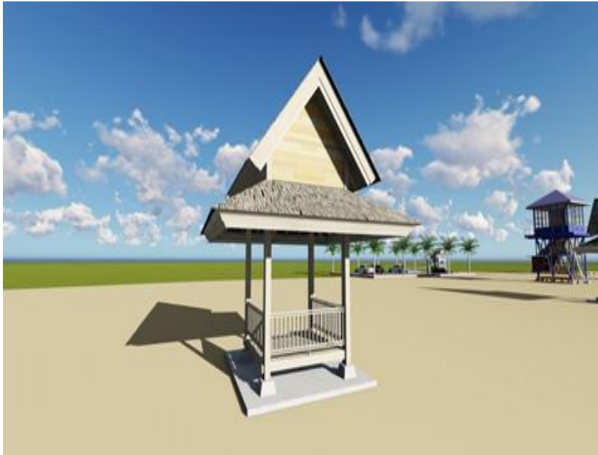
Gambar 15: Desain Gazebo di Kawasan Pantai Canada (Peneliti, Juni 2025)

Gazebo (Gambar 15) sebagai tempat berteduh para wisatawan juga bisa menjadi tempat untuk bersantai dan spot foto dengan menikmati kawasan Pantai Canada. Konsep peneliti buat untuk dijadikan rekomendasi bagi pihak yang akan membangun Pantai Canada. Lebih jauh, keberadaan gazebo dapat diintegrasikan ke dalam konsep zonasi ruang terbuka publik di kawasan pantai, berfungsi sebagai node interaksi sosial dan titik istirahat. Hal ini penting dalam perencanaan destinasi wisata agar pengunjung tidak merasa cepat lelah, serta memiliki ruang untuk beraktivitas santai seperti membaca, berbincang, atau sekadar menikmati angin laut. Gazebo juga mendukung mobilitas wisatawan manula dan keluarga dengan anak-anak, karena menyediakan tempat singgah yang nyaman dan aman. Dengan mempertimbangkan fungsi ekologis, sosial, dan estetika, desain gazebo ini diharapkan dapat menjadi model fasilitas penunjang yang relevan dengan kebutuhan pengunjung sekaligus memperkuat citra Pantai Canada sebagai destinasi wisata yang inklusif, nyaman, dan berwawasan lingkungan. Rekomendasi pembangunan gazebo ini tidak hanya menambah fasilitas fisik, tetapi juga memperkaya nilai pengalaman wisata secara keseluruhan.