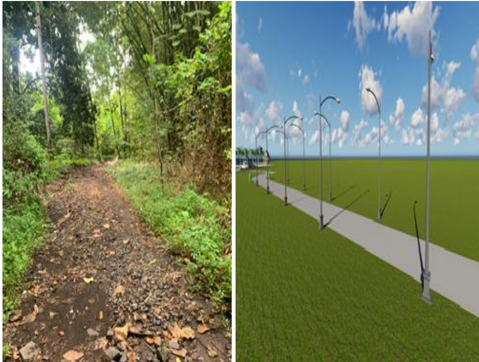
Gambar 9: Kondisi existing dan plan disain Lampu Jalan menuju Lokasi (Peneliti, 2025)