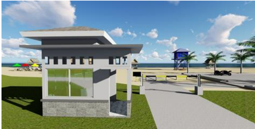
Gambar 11: Hasil Desain Pos Masuk (Peneliti, Juni 2025)

Secara struktural, desain bangunan memperlihatkan bentuk yang modern namun fungsional, dengan bukaan jendela besar di sisi depan dan samping untuk memaksimalkan visibilitas dan interaksi petugas dengan pengunjung. Letaknya yang strategis di pintu masuk utama memungkinkan pos ini juga berperan sebagai titik koordinasi awal bagi petugas keamanan dan tim layanan darurat dalam menangani situasi insidental di kawasan pantai. Selain itu, area ini dapat dimanfaatkan untuk menyosialisasikan aturan-aturan penggunaan kawasan wisata kepada pengunjung guna menjaga kenyamanan dan keselamatan bersama. Dengan demikian, pembangunan pos masuk sebagaimana tergambar dalam desain ini menjadi bagian integral dari upaya peningkatan manajemen kawasan Pantai Canada secara lebih profesional, aman, dan informatif, sejalan dengan prinsip pengembangan destinasi wisata berbasis tata kelola yang baik ( good tourism governance ).