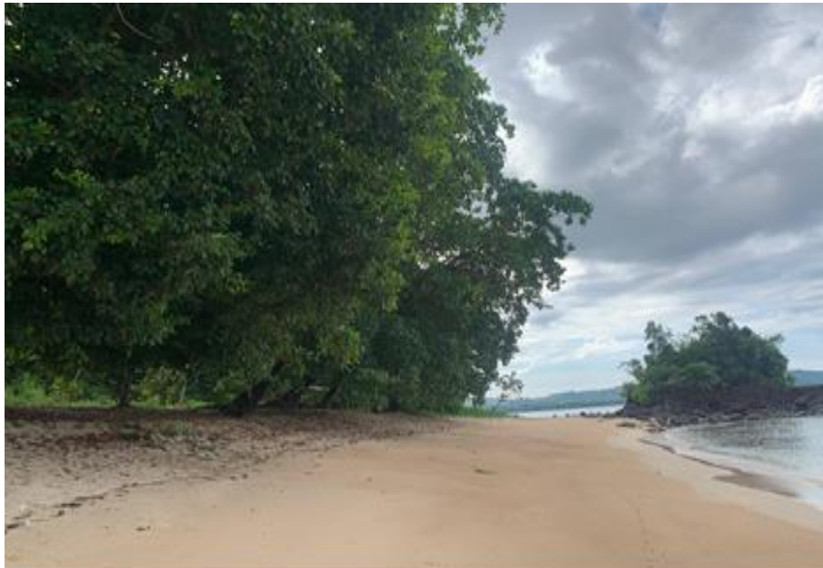
Gambar 1: Pantai Canada (Peneliti, 2025)

Gambar 1 menunjukkan kondisi fisik Pantai Canada yang terletak di wilayah pesisir Kota Bitung, Sulawesi Utara. Pantai ini memiliki karakteristik geomorfologi berupa garis pantai yang memanjang dengan pasir putih halus yang membentang luas, menciptakan panorama pesisir yang memukau. Air laut tampak jernih dan bergradasi biru kehijauan, mencerminkan tingkat kebersihan dan kualitas lingkungan perairan yang masih terjaga.