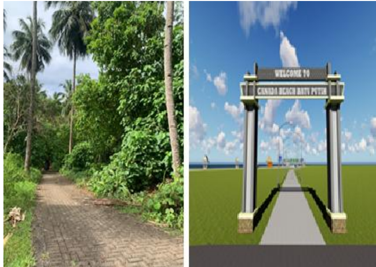
Gambar 8: Kondisi existing dan plan disain Gapura (Peneliti, 2025)

Sebaliknya, gambar sebelah kanan menampilkan desain simulasi gerbang masuk yang direncanakan sebagai bagian dari pengembangan destinasi. Gerbang ini bertuliskan "Welcome to Canada Beach Batu Putih" dan dirancang dengan struktur arsitektural yang simetris dan monumental, memberikan kesan formal sekaligus mempertegas identitas kawasan wisata. Elemen ini diharapkan mampu meningkatkan kesan pertama ( first impression ) bagi wisatawan, sekaligus berfungsi sebagai titik foto ( photo spot ) yang potensial di era pariwisata digital. Transformasi ini mencerminkan pendekatan pembangunan berkelanjutan berbasis desain destinasi ( destination design-based development ), yang tidak hanya mempertimbangkan aspek fungsional infrastruktur tetapi juga nilai estetika, identitas lokal, dan pengalaman pengunjung. Oleh karena itu, integrasi elemen visual seperti gerbang masuk menjadi langkah strategis dalam meningkatkan citra dan daya saing destinasi Pantai Canada di kancah pariwisata daerah maupun nasional.