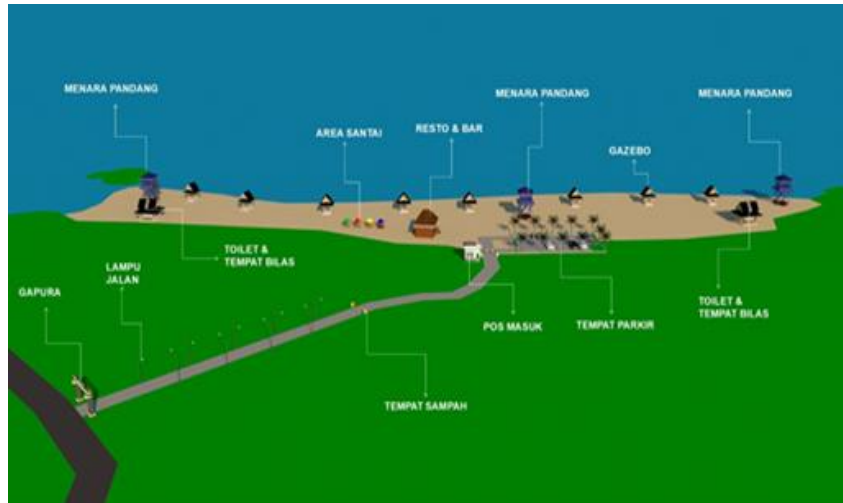
Gambar 7: Hasil Desain Master Plan (Peneliti, Juni 2025)