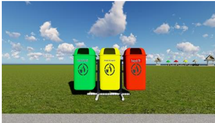
Gambar 10: Hasil Desain Tempat Sampah (Peneliti, Juni 2025)

Tempat sampah merupakan fasilitas esensial dalam mendukung upaya pelestarian lingkungan, terutama di kawasan wisata seperti pantai. Ketersediaan tempat sampah yang memadai dan terstandarisasi berperan penting dalam mencegah pembuangan sampah sembarangan, menjaga kebersihan kawasan, serta meningkatkan kenyamanan dan pengalaman pengunjung.