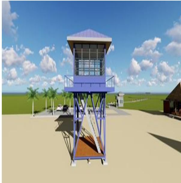
Gambar 14: Hasil Desain Menara Pandang di Kawasan Wisata Pantai Canada (Peneliti, Juni 2025)

Menara pandang berfungsi sebagai pengawas keamanan bagi pengunjung yang sedang mandi di pantai yang selalu dipantau oleh petugas pelelola pantai demi keselamatan para wisatawan yang berkunjung. Menara ini dapat dimanfaatkan juga sebagai spot foto bagi para wisatawan. Selain fungsi keamanan, menara pandang ini juga dirancang sebagai bagian dari elemen estetika kawasan, sekaligus menjadi salah satu ikon visual yang menarik untuk kegiatan fotografi wisata. Wisatawan dapat memanfaatkan area sekeliling menara sebagai latar foto dengan nuansa eksotis dan latar belakang laut biru terbuka. Keberadaan menara ini direkomendasikan sebagai salah satu infrastruktur vital dalam pengembangan destinasi wisata bahari yang aman, responsif terhadap risiko, serta mendukung kenyamanan dan daya tarik visual kawasan. Kombinasi fungsi protektif dan estetis menjadikan menara pandang ini sebagai elemen penting dalam rencana desain terpadu kawasan Pantai Canada.