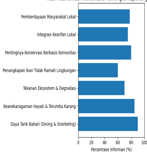
Gambar 1: Hasil Wawancara (Tim peneliti, 2024)